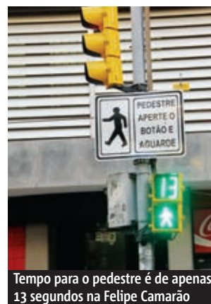
Tempo para o pedestre é de apenas 13 segundos na Felipe Camarão

Em outro ponto da cidade, no Centro Histórico, o desrespeito às regras predomina do lado dos motoristas. Na rua Dr. Flores, esquina com a Rua dos Andradas, não há sinaleira. Em tese, a preferência é total do pedestre na faixa de segurança – e são duas a menos de cin-